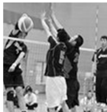
札幌連盟ホームより撮影

今年度も各地区で開催される 8 回の北海道大会に参加され優秀な成績をあげて この選 優勝大会に出 することが出来ますように ご期待申し上げます。