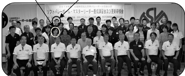
新規取得者で記念撮影