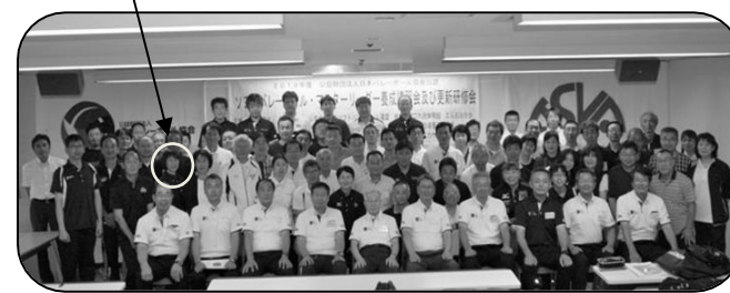
更新取得者で記念撮影